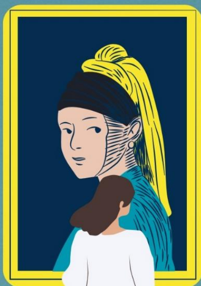
Table ronde de l'IREDIC